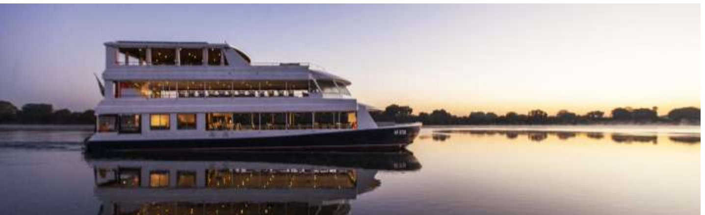
SUNDOWNER CRUISE IN ZAMBEZI