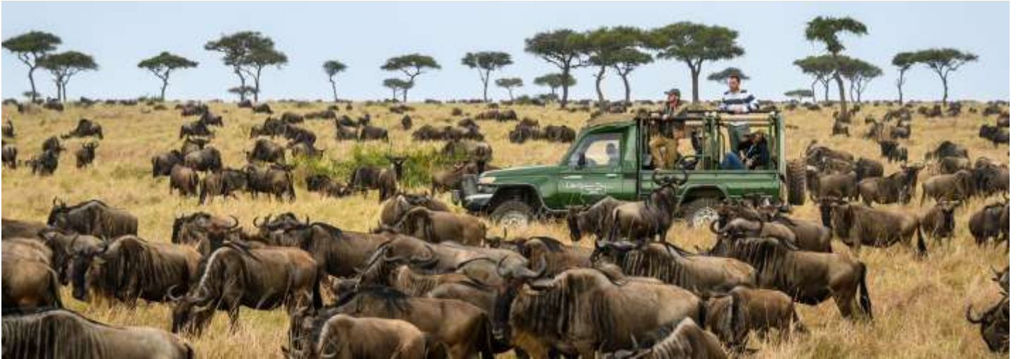
GAME DRIVE: MASAI MARA NATIONAL RESERVE