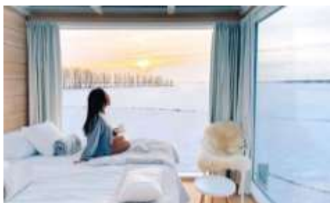
SEASIDE GLASS VILLAS